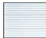
Nervures acier finition woodgrain.