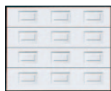
Cassettes acier finition woodgrain.

Grâce à son automatisme Novomatic® 200 , elle vous assure encore plus de confort et de sécurité au quotidien. Les panneaux sont en acier galvanisé prélaqué blanc RAL 9016, aspect veinage du bois (woodgrain).