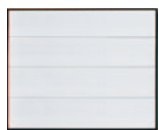
Sans nervures acier finition woodgrain.